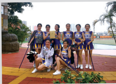
本刊讯（东海学院 王蓓）由厦门