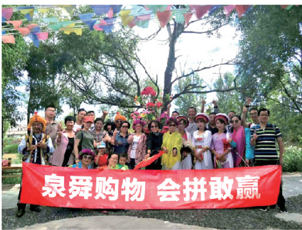
民族的异域风情，在以后的工作中，我会更加努力回报公司对我的厚爱。

很荣幸我被评为“2016年集团及公司优秀员工”，感谢公司对我工作的认可，同时作为鼓励，可以带家人一起享受假期。做好本职工作本应该是我的责任，但是公司却给予了我这么优厚的待遇，让我及家人欣喜万分。